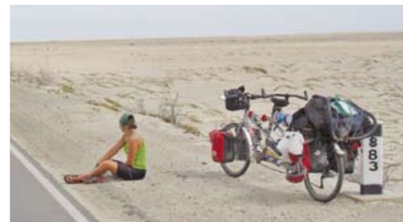
En tandem au Nord du Pérou (janvier 2008)

J'ai toujours cru dans un monde plus juste et, comme le chante si bien Ben Harper, je crois qu'essayer de « changer le monde avec mes deux mains » est plus effectif que de se plaindre. Le commerce équitable est, pour moi, un pas dans la direction d'un « mundo mejor ».