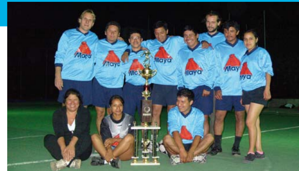
L'équipe de football de Guaya'b aux couleurs de Maya avant la rencontre internationale de « papyfoot » Guaya'b – Rio Azul (Jacaltenango, Guatemala, 12/2/09)

Trois jours de visites. Plusieurs réunions et tours d'horizon de ruchers ont lieu, chacun d'eux dans un esprit cordial et d'intérêts réciproques. Un après-midi, un atelier de dégustation