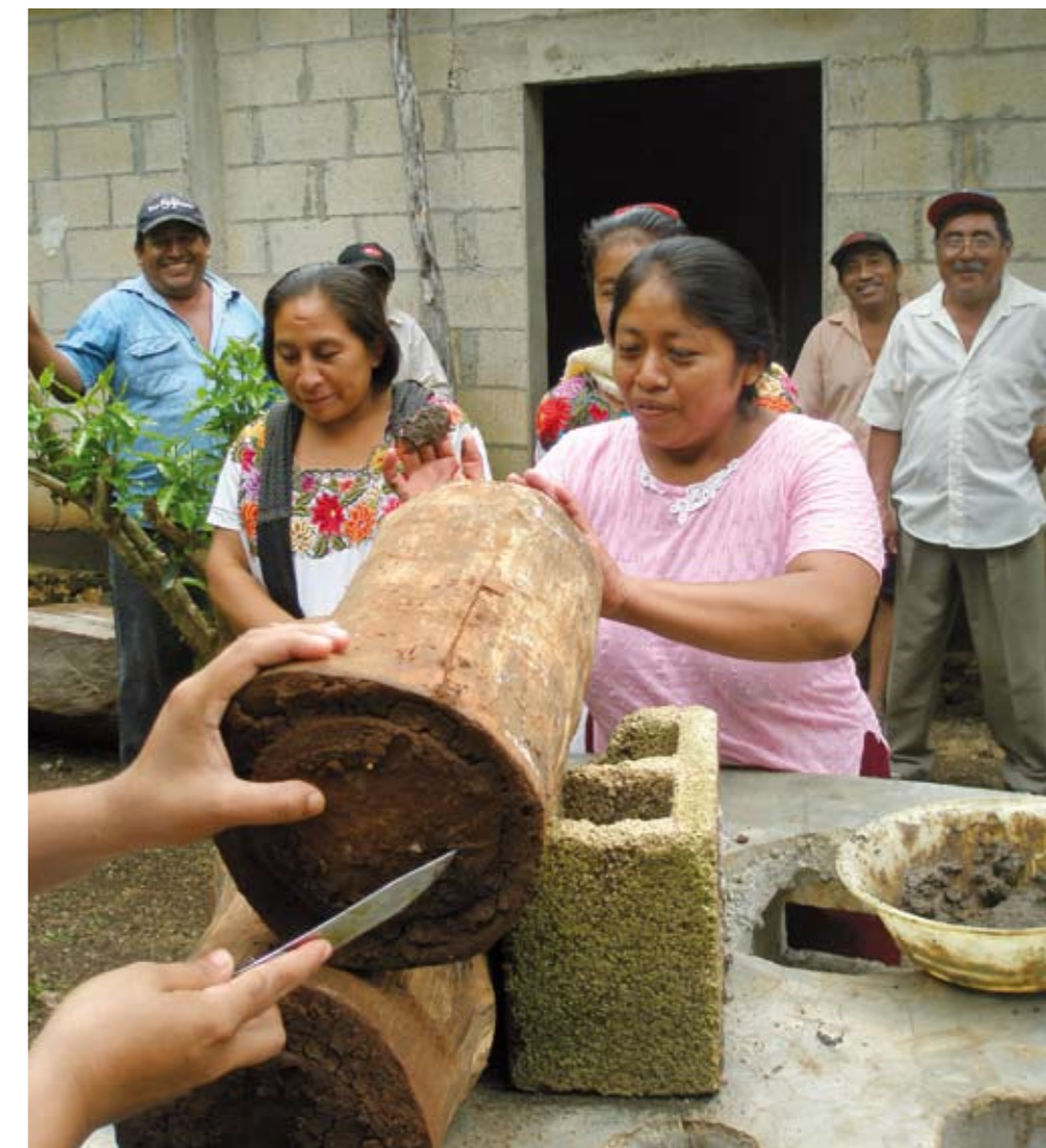
Apiculture avec les abeilles mélipones (Hopelchen, Campeche, Mexique, 5/10/08)

Egalement située au Chiapas, la Selva Lacandona est un nouveau partenaire de MMH depuis le début du programme 2008-2010. C'est chez eux qu'a été organisé, en septembre dernier, l'atelier qui a réuni MMH et ses partenaires. En effet, les installations de l'organisation sont grandes et spacieuses. La Selva Lacandona a déjà mis beaucoup de choses en place pour répondre aux normes européennes d'exportation. Voir cela a motivé les organisations qui débutent en la matière.