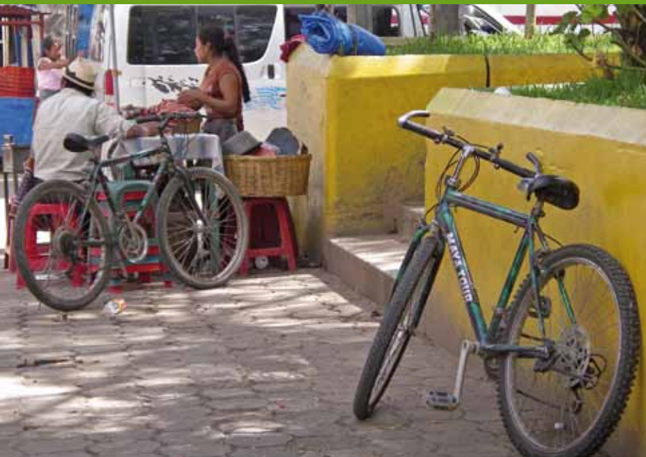
Sur la route vers Nebaj, à Aguacatán, 28/8/09 (Guatemala).