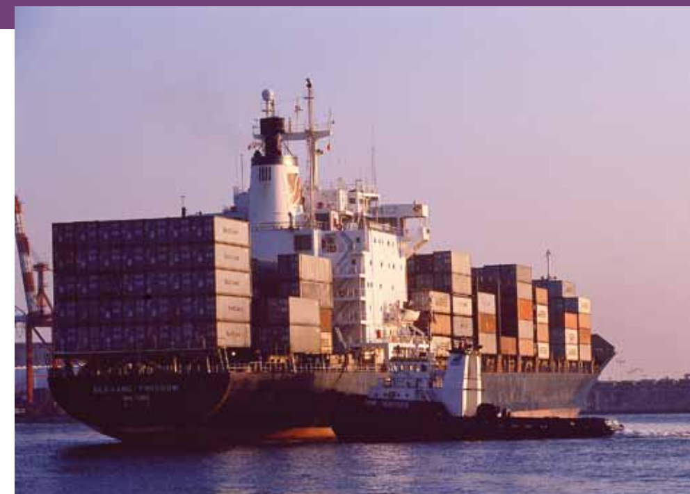
Porte-conteneurs, port de Veracruz, Mexique (avril 1999).

L'empreinte écologique d'un produit, c'est aussi ses conditions de production et de transformation, soit l'ensemble de son cycle de vie. En prenant cela en compte, on arrive à des conclusions assez différentes. Par exemple, les émissions produites par la culture de roses équitables au Kenya et le fret aérien vers le Royaume-Uni n'atteignent