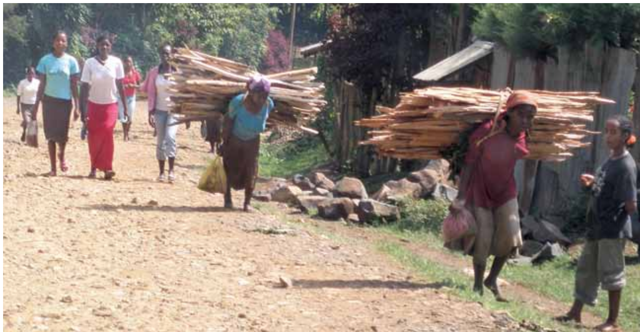
Femmes portant une charge de bois, Bonga, Ethiopie (20/5/09).