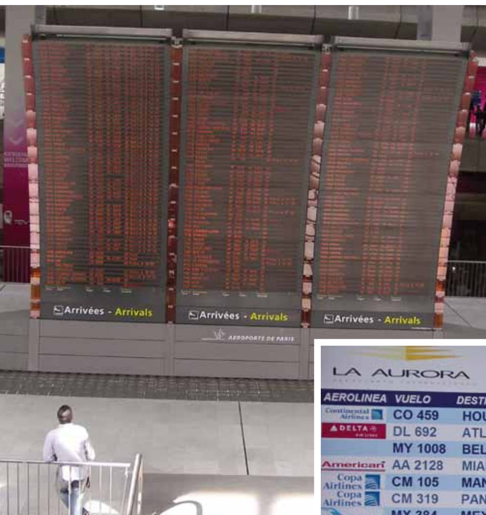
Tableau des arrivées à l'aéroport de Paris, Charles de Gaulle, entre 14 h et 19 h (2/09/09). Population de la France au 1/1/08 : 63,7 millions (Insee).