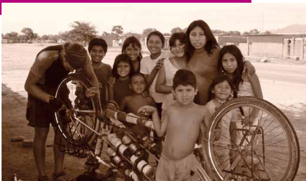
Étonnement devant un tandem, de la nourriture soluble, la Belgique... : autant de choses dont ils n'avaient jamais entendu parler! (Pérou, 22/2/08).

Le programme «Annoncer la Couleur» soutient les écoles qui souhaitent faire de leurs élèves des citoyens du monde. Pour cela, les écoles peuvent demander l'aide d'une ONG. MMH accompagne les écoles pour l'organisation d'un projet à longue échéance concernant