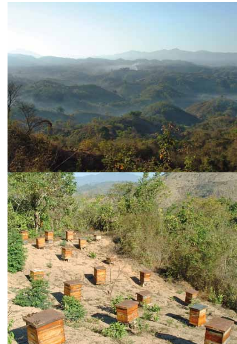
En haut : Paysage du Guerrero au lever du jour. En bas : rucher certifié bio de l'organisation Urech (Mexique, mai 2006).