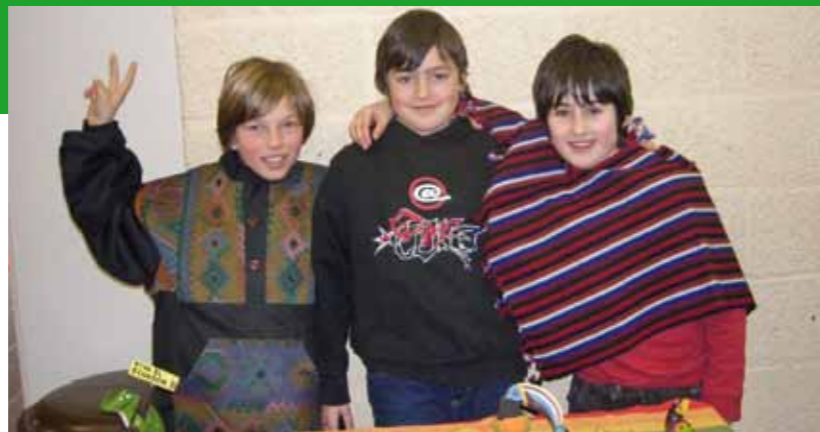
Les élèves de quatrième année primaire, « Ecuadordag », commune de Bierbeek, 04/03/2010.

La commune de Bierbeek a déjà obtenu le titre de « commune équitable » et ses écoles sont actives grâce à un échange avec l'Équateur. Les écoles veulent s'engager et nous avons reçu une demande pour approfondir le thème du commerce équitable avec