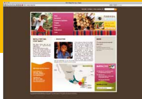
Notre nouveau site www.maya.be est en ligne !