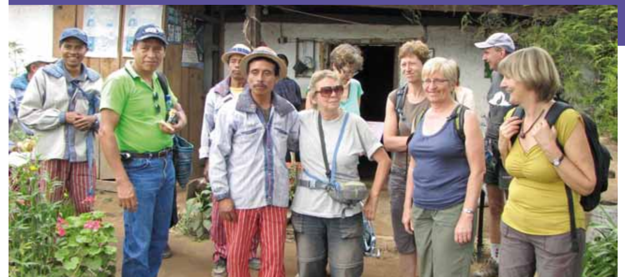
En visite chez un apiculteur de Todos Santos Cuchumatán, Todos Santos, 22/04/10.