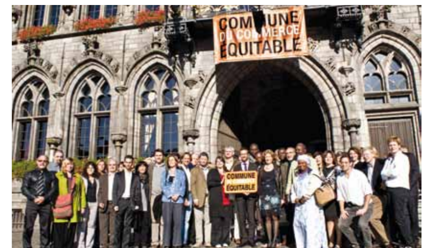
Remise du titre de Commune du Commerce Equitable-Ville de Mons-2010