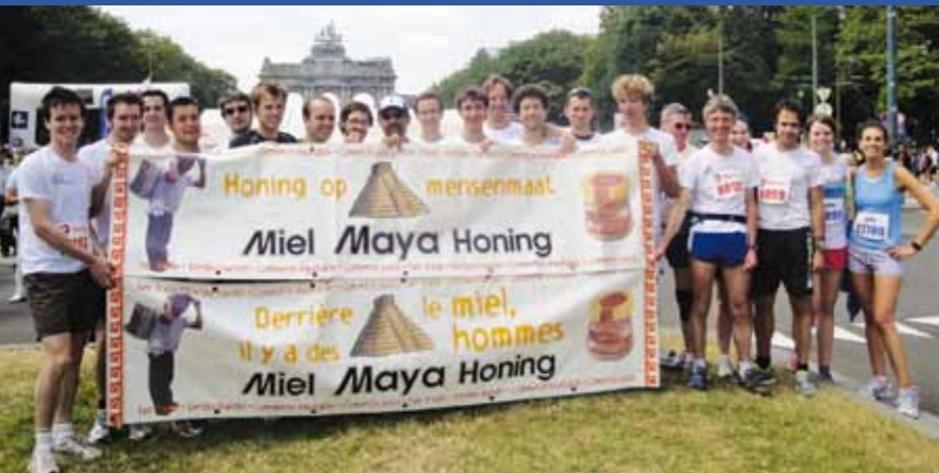
Le 29 mai, l'équipe MAYA était représentée par 25 coureurs aux 20 km de Bruxelles ! Merci à eux et à leurs sponsors !