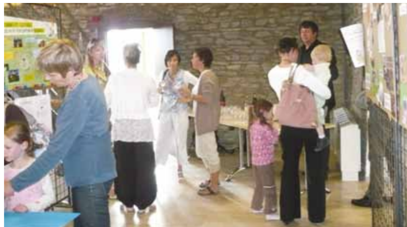
Exposition Ecole Saint-Hadelin de Olne, mai 2011

Ces projets aboutissent en général à des expositions, des spectacles ou des déjeuners équitables. Cette transmission d'apprentissage a un double objectif : donner un sens à ce que les élèves ont réalisé et