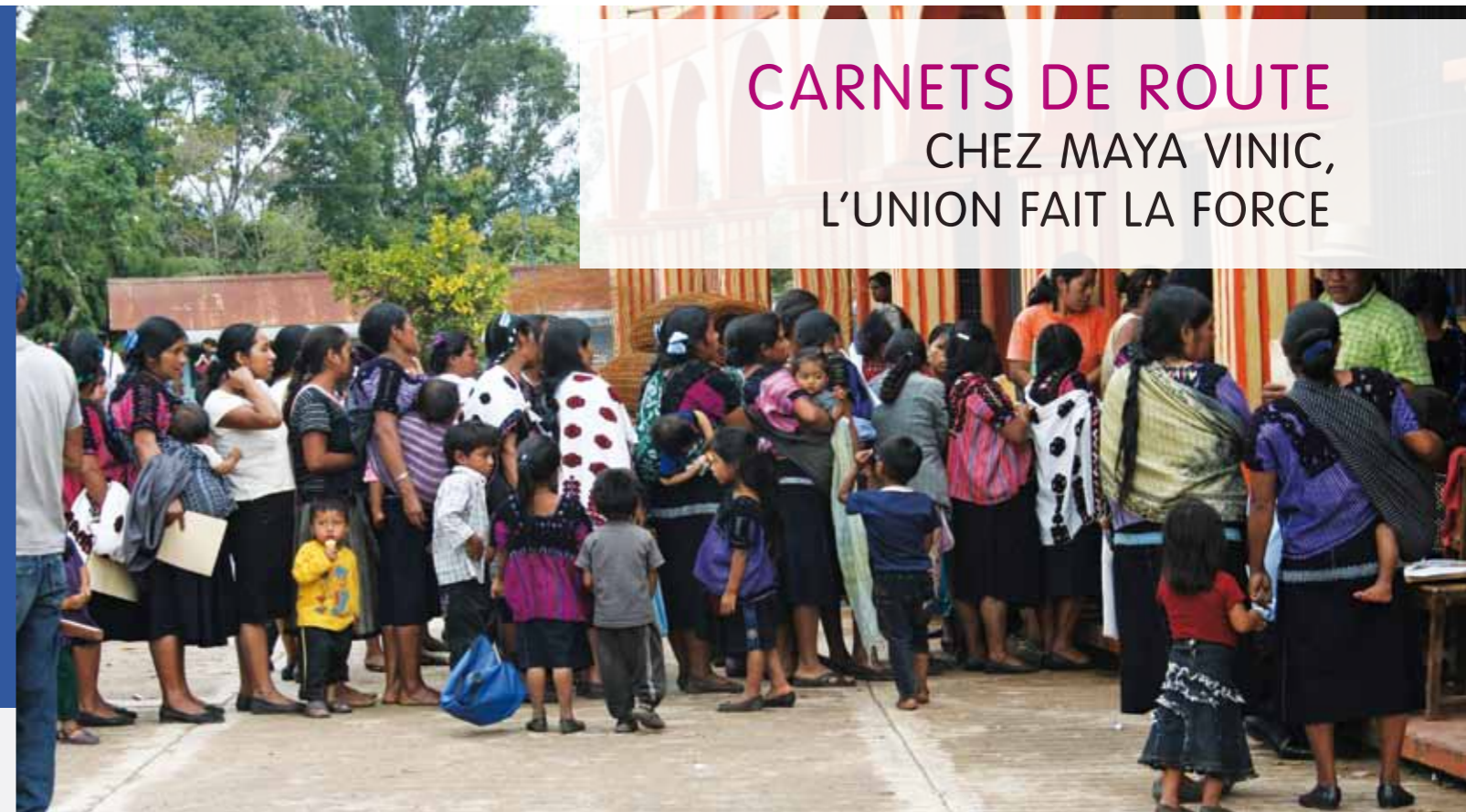
Rentrée scolaire à Chenaló (Chiapas, Mexique), septembre 2010

Dans le cadre de mon Master en Développement et Souveraineté Alimentaire (Université de Rome, Italie), j'ai enquêté auprès de 35 apiculteurs de la région du Chiapas (Mexique), membres de la coopérative Maya Vinic.