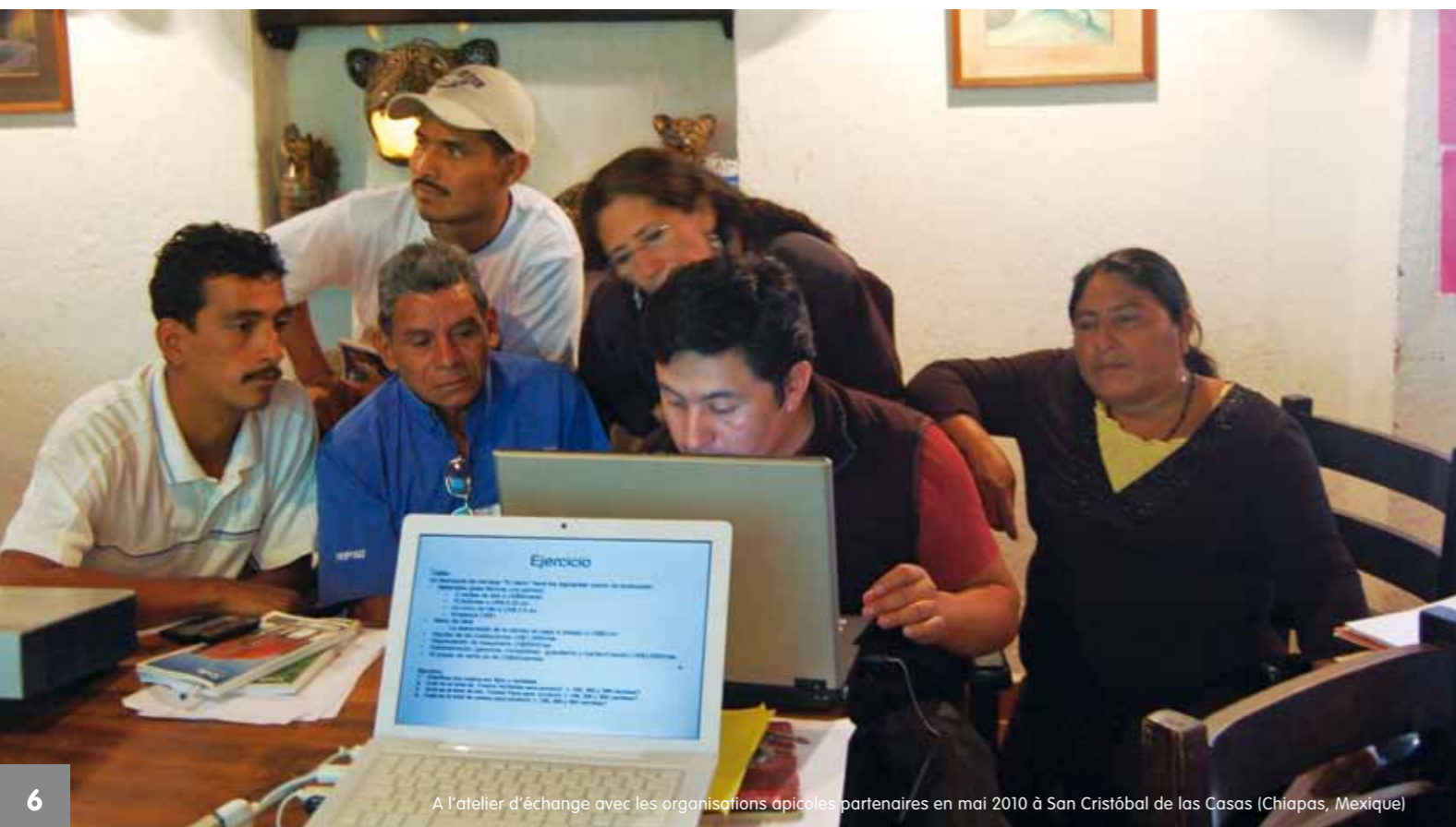
6 A l'atelier d'échange avec les organisations apicoles partenaires en mai 2010 à San Cristóbal de las Casas (Chiapas, Mexique)

3 membres de chaque organisation (30 participants au total) participeront aux 4 modules de formation ; un temps de partage avec les autres membres de l'organisation sera organisé entre chaque module. La méthodologie des modules sera participative, le travail sous forme d'atelier et les dialogues constructifs seront privilégiés.