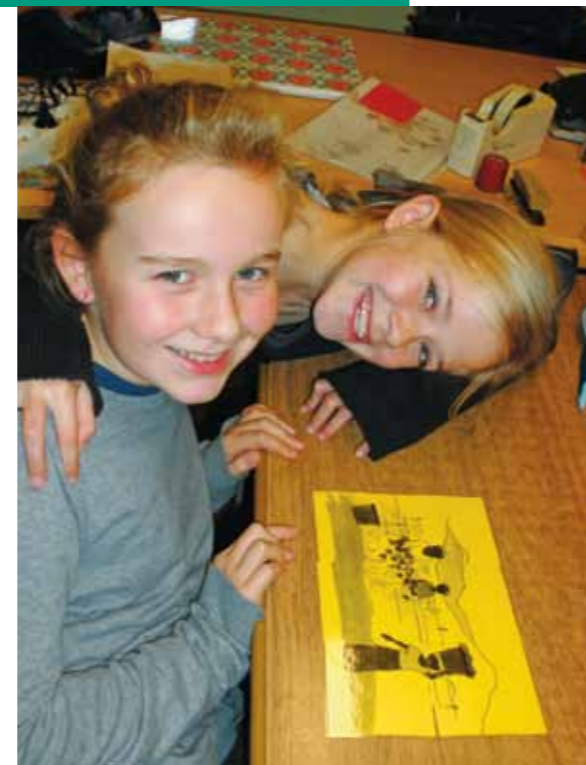
Animation «travail décent» et «Paola, poule pondeuse» à l'école GBS de Vossem, novembre 2011

Les élèves de 3 ème et 4 ème primaire de l'école de Vossem ont, eux, travaillé sur le thème du travail décent, en s'appuyant sur le film «Paola, poule pondeuse». Ils ont réfléchi sur le commerce équitable comme moyen de garantir de bonnes conditions de travail et découvert comment