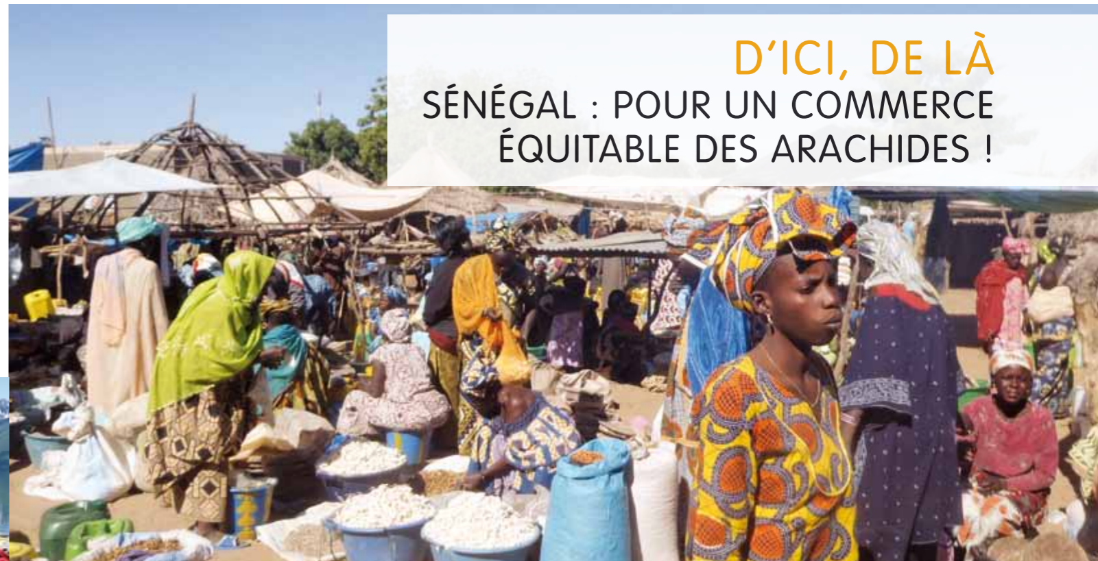
Sur la route de Sine Saloum, Sénégal, février 2011

Lors de mon stage au Sénégal de novembre 2010 à avril 2011, j'ai pu observer combien la culture des arachides était importante pour l'économie de ce pays. Une expérience qui m'a aussi permis de découvrir le commerce équitable et m'a donné envie de m'investir dans ce domaine.