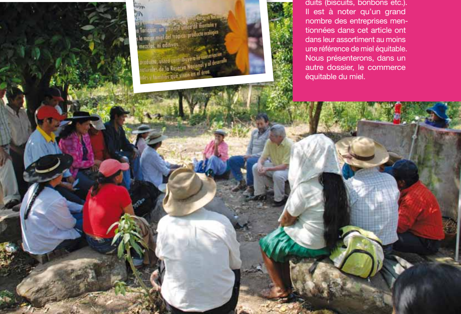
Réunion avec les apiculteurs de la réserve naturelle de Tariquia, Bolivie (29/09/11) et étiquette du miel de Tariquia vendu localement.