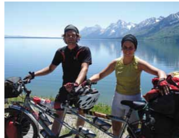
En tandem à travers les Etats-Unis, juillet 2007

Ceux qui souhaitent suivre le fil de nos aventures sont invités à visiter notre site www.opdentandem.net . Le plus grand risque dans la vie est celui qu'on ne prend pas !