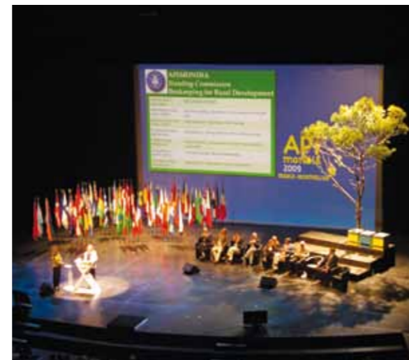
Cérémonie inaugurale d'Apimondia 2009 (Montpellier, France)

Du côté francophone, l'UFAWB (Union des Fédérations Apicoles de Wallonie et de Bruxelles) rassemble les fédérations provinciales mais