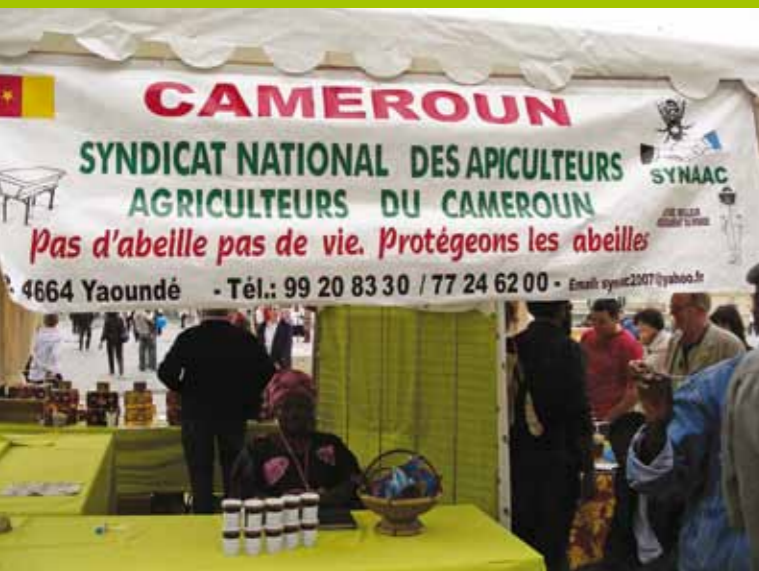
Stand au Congrès Apimondia de Montpellier, septembre 2009.