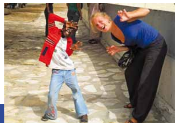
Sénégal, janvier 2011

à l'édifice en transmettant aux élèves et à leurs enseignants une image plus correcte des réalités locales.